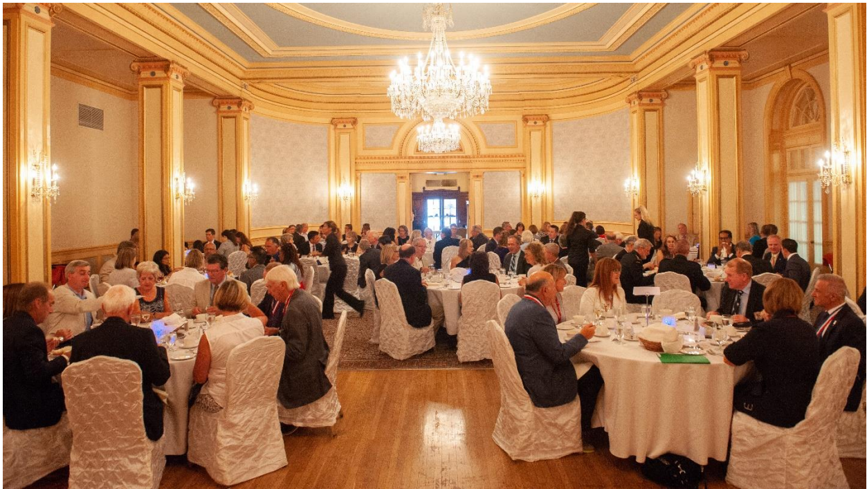
Georgian Ballroom & Terrace